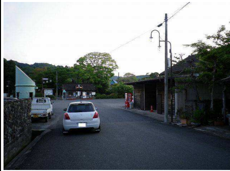
29図 『上総中野駅』前 電柱