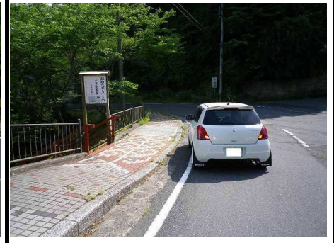
31図 『大多喜城駐車場』前 左手の看板