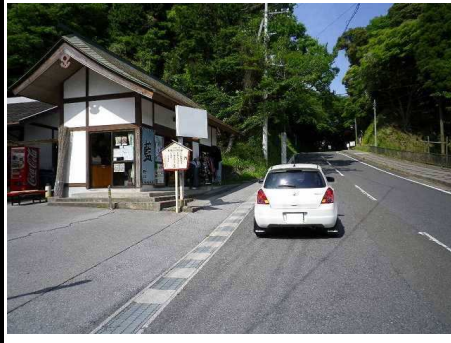
31図 『大多喜城駐車場』左 手の五角形の看板