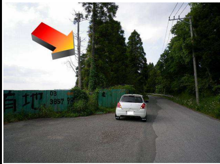
41図先 左手の手前の木