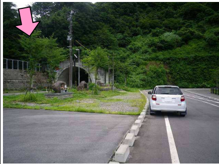
3図 『広神ダム』 左手の一番手前の木