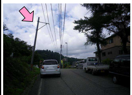
26図先 『山古志闘牛場』前 左手の電柱