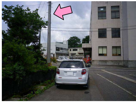
1図 『越後広瀬駅』駅前 左手の電柱