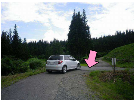
11図 路面の継ぎ目(境目)