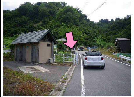
9図 『中山隧道』 左手の白色フェンスの手前端