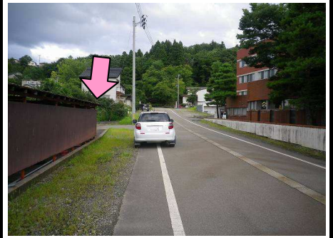
33図『長岡温泉』入口 左手の茶色の建物(駐輪場)の前端