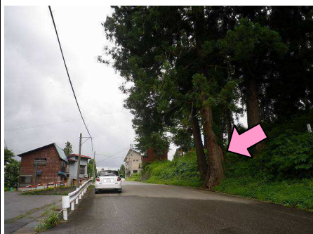
23図先 『古志高原 白髭神 社』前 一番道路寄りの一番太 い木の中心