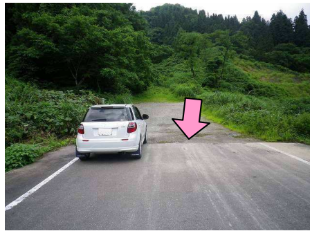
31図『国道352号線 長岡側未開通部』 舗装とダートの境目