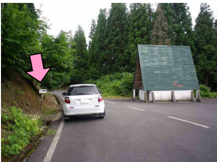
20図先 『金倉山展望台』 左手の「←山頂展望台」看板