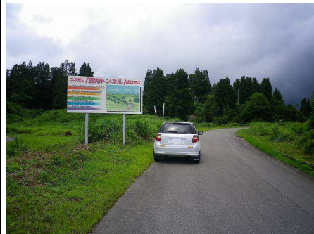
14図 左手の「萱峠トンネル」 建設予告看板

クイズ(Q-H)を解く場合は、手前 にあった駐車場に車を停めて ください。停めた方が良いと思 います(笑)