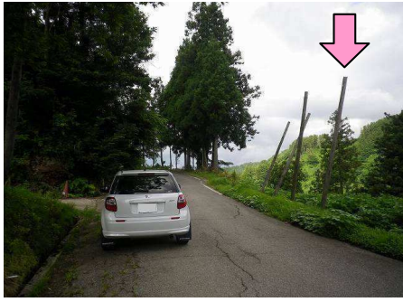
29図先『林道 真木・半蔵金線』 右手の4本の柱の一番手前の柱