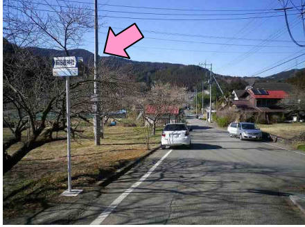
25図先 『菘日吉神社』 左手の電柱