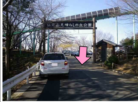
31図 『仙元山見晴らしの丘公園』 入口のグレーチング