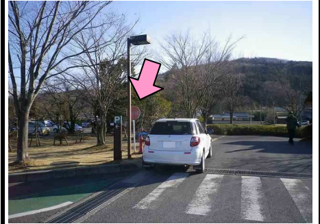
34図 『道の駅 おがわまち』 左手の消火栓標識