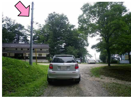
30図 『岩村城址 出丸』 駐車場入口 左手の電柱