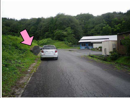
33図先 『名連・恵那工場』前 左手の擁壁手前端