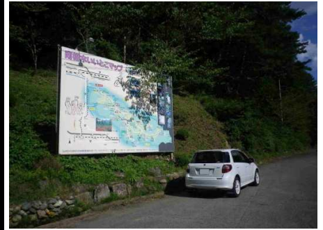
30図 『不戦の像 駐車場』 左手の案内板 前端