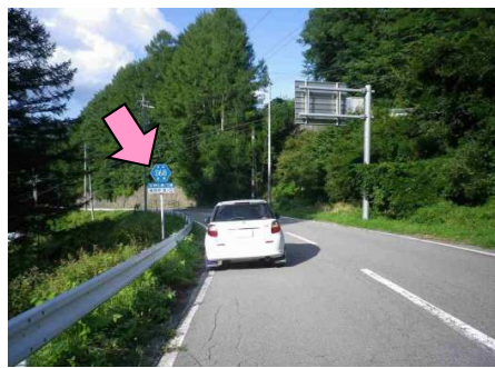
33図 左手の県道標識