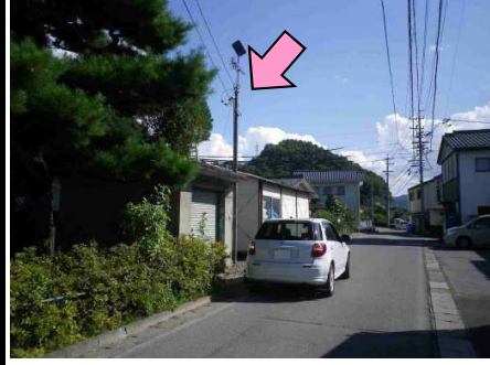
28図 『東馬流集会施設』前 左手の電柱