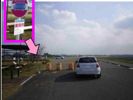
6図先 『某公園』前 左手のバス停