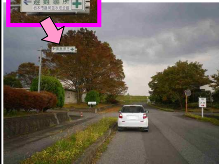
18図 『栃木市藤岡遊水池会館』前 左手の案内標識