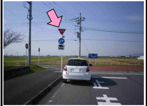
2図 『道の駅 思川』 駐車場出口 左手の規制標識