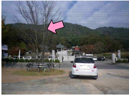
1図 『道の駅 みかも』 駐車場出口 左手の木