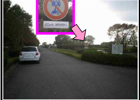
22図 『渡良瀬遊水地』駐車場前 右手の規制標識