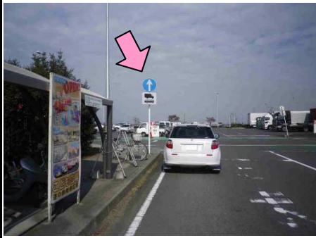
2図 『道の駅 思川』 駐車場入口 左手の規制標識