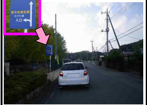
8図 『ホフマン館』前 左手の案内標識