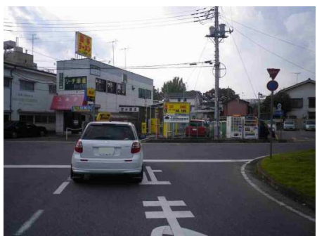
9図 『古河駅』 ロータリー出口の停止線