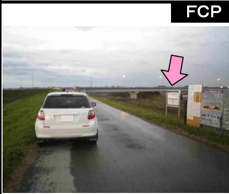
34図先 『わたらせ自然館』 右手の案内標識 速やかに右手の駐車スペース に移動のこと