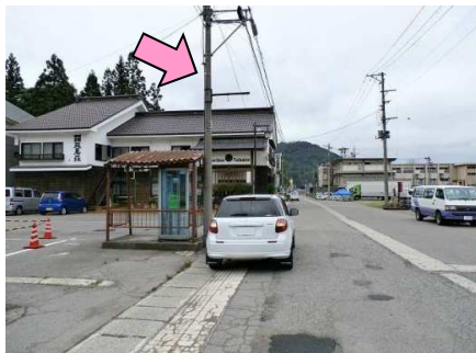
28図 『只見駅』 電話BOX横の電柱