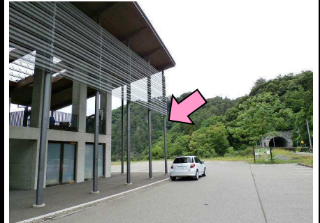
7図 『道の駅・尾瀬街道みしま 宿』 一番奥の柱