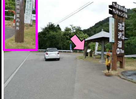
20図 『水沼公園』路側帯 右手の「只見川案内看板」