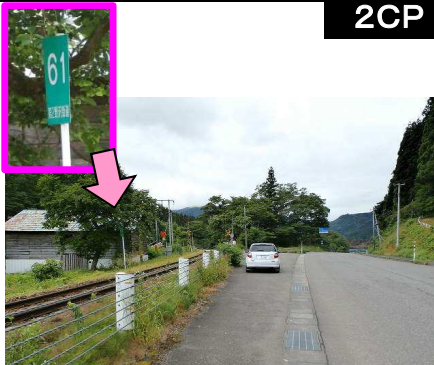
10図 『会津西方駅』近く路側 帯 線路側にある「61」標識