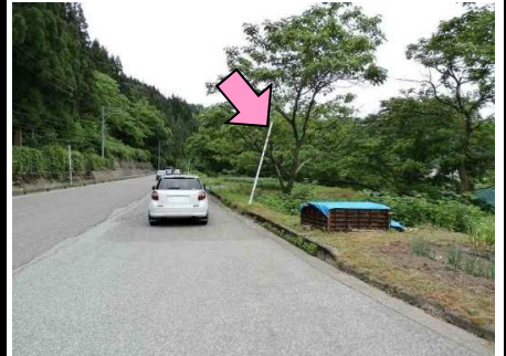
22図 路側帯 右手のポール