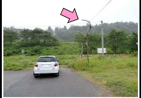
32図 『会津横田駅』前 右手の外灯

ゴール後Uターンする場合は、右手の空き地で行ってください。左手は民家の敷地です。