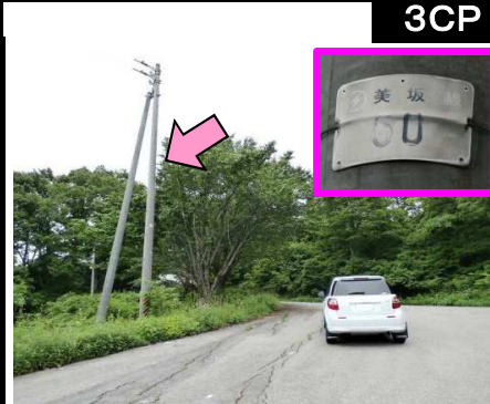
12図 『美坂高原』駐車場 電 柱(美坂線50) ※駐車場の白線枠が不鮮明のため、 車が停まっている場合、位置がずれる かもしれません。