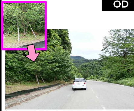
4図先 路側帯(センターライン が出てすぐ)にある添え木が付 いた木 ここまで、6.851 km 手前右手に『滝谷駅』への道あり