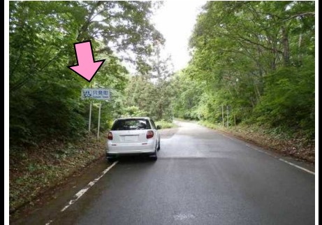
24図先『松坂峠』 只見町境標識