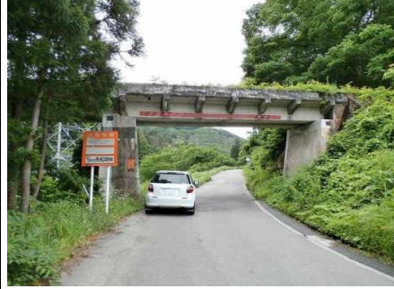
24図先すぐ『只見線・入山川橋梁』手前角