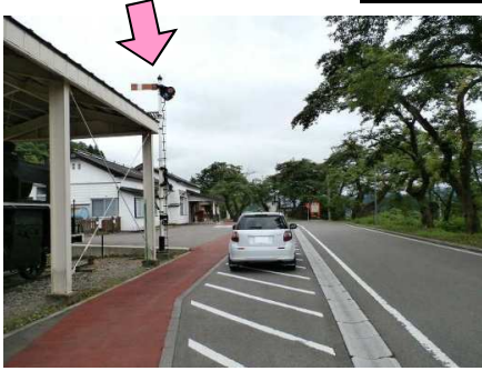
1図 『会津柳津駅』 腕木信号機