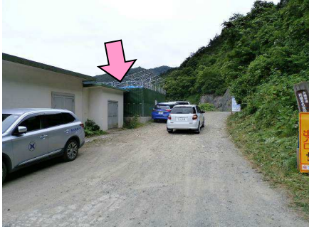
23図 『本名ダム』 左手建物の先端

再スタートは、Uターンして同じ場所からダートを少し進むとUターンできる場所があります。