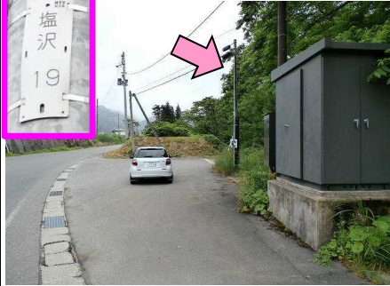
29図 路側帯 右手の電柱(塩沢19)