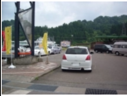
21図 左手のモニュメント 速やかに駐車スペースに移動 の事