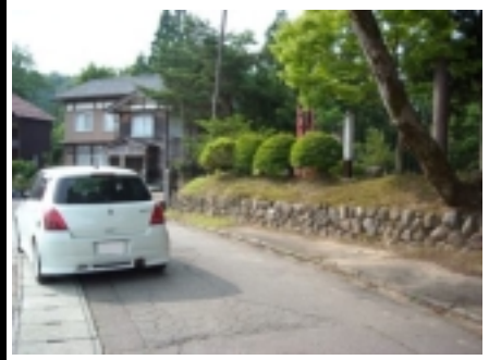
24図先 右手の『松尾神社の 二本杉』の案内柱 速やかに駐車スペースに移動 の事