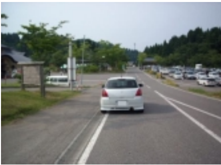
27図 左手の裏向き案内板手 前の脚 速やかに駐車スペースに移動 の事