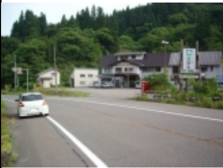
29図先 右手の『月湯女の湯』 看板 車の流れが速く、通行量も多い ので注意！