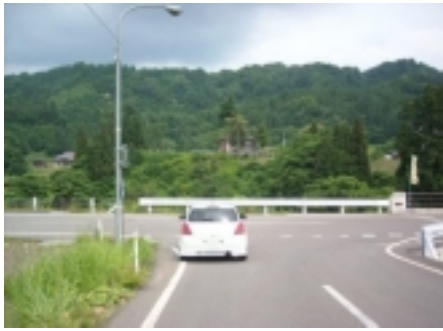
20図 水銀灯 速やかにスタートの事