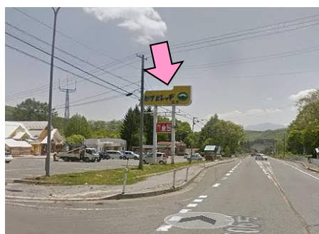
3図先 『道の駅 区界高原』 左手の看板