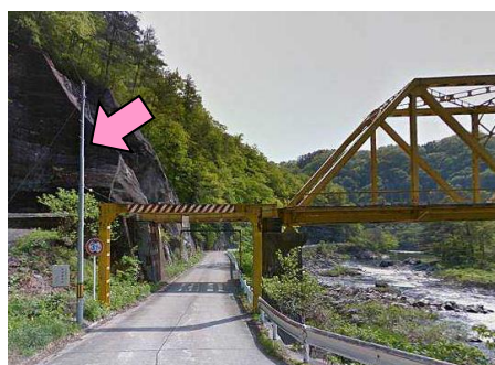
4CP~7CP間の何処かにある 「黄色い鉄橋」の手前の電柱

例えば 4CPと5CP間にあつた場合、 4CP~XCP XCP~5CP の距離を計測してください。