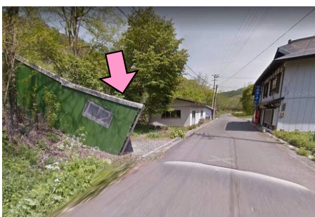
4図先 『松草駅』前 左手の建物(階段)