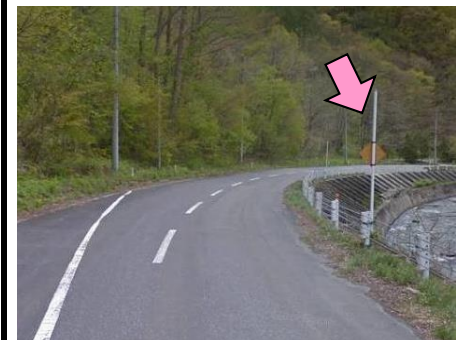
8図 右手の裏向き標識