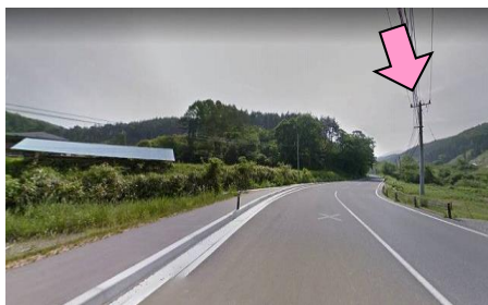
2図 右手の電柱 ここまで、8.7 km