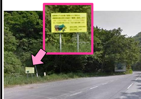
2図先 左手の路側帯にある看板