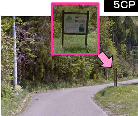
12図先 右手の案内板